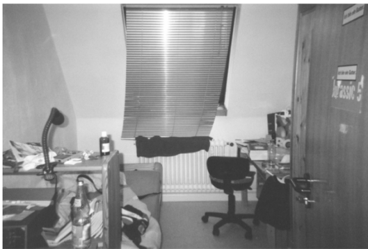
„Klein, unordentlich, aber es ist mein Zimmer. Und es gefällt mir.“

Fotoaparati jepet për një ditë dhe fotografi bëjnë foto të gjërave që janë të rëndësishme në jetën e vet (vende të preferuara, persona, aspekte të rëndësishme në jetë, etj.). Pesë fotografitë më të rëndësishme shtypen dhe ngjiten në një fletë të madhe. Nën secilën fotografi, shtohen komente të shkurtra shpjeguese. Informacionet më të detajuara që jepen me fotografi mund të ndihmojnë mësuesit të kuptojnë më shumë për nxënësit dhe jetën e tyre.