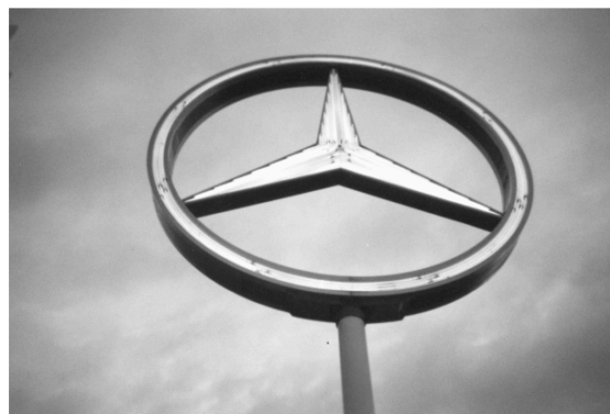
„Mein Lieblings Auto !!!“

„E vogël, e çrregullt, por është dhoma ime. Dhe unë e dua atë”