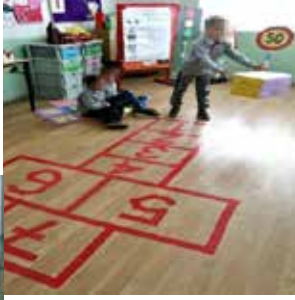
Resimler 1-5: İÖÖ "Strašo Pincur" Alanın organizasyonundan örnek, Malo Konyare köyü, Kadino Köyünde Bölgesel okul