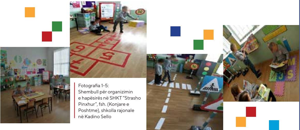
Fotografia 1-5: Shembull për organizimin e hapësirës në SHKT "Strasho Pinxhur", fsh. (Konjare e Poshtme), shkolla rajonale në Kadino Sello