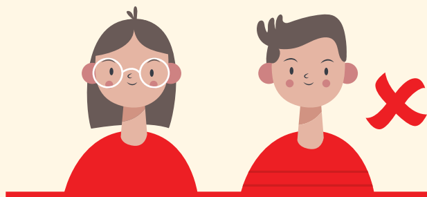
НЕГАЦИСКИ ТИМ (Тим што ја негира тезата)

Вториот афирмативен и вториот негативен говорник имаат примарна цел да ги потенцираат точките на судир во дебатата преку задржување на дискусијата на главните разлики меѓу ставовите на афир-